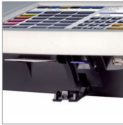
GIORNALE DI FONDO ELETTRONICO, USB MASTER E LETTORE CHIP CARD INTEGRATO